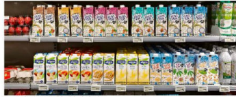
Das Angebot an Vegi-Milch wächst laufend.

Auch Nestlé will mitmischen Nestlé plant in den kommenden Wochen den Verkaufstart einer Pflanzmilch aus gebleichten Erbsen: zunächst in Frankreich, den Niederlanden und Portugal und etwas später dann auch in der Schweiz und anderen Ländern Europas. Das Produkt ist leicht geräuchert und soll neutral schmecken. Nestlé vermarktet es für sämtliche Einsatzgebiete – von Frühstücksmilch über Kaffee bis hin zum Kochen und Backen. Das neue Produkt soll