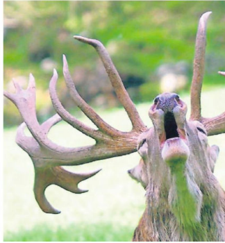
Der Rothirsch, ein majestätisches Tier.

In der Jagdgemeinschaft sind auch die Forstbetriebe Kelleramt/Zuffikon und Mutschellen sowie das Kreisforstamt vertreten. Leiter ist Urs Kelleramt.