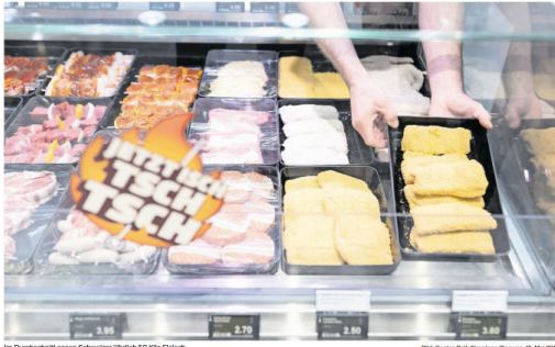
Im Durchschnitt essen Schweizer jährlich 50 Kilo Fleisch.

...mit radikaleren in einer ist. Sie wollen die Massen- rung von Tieren stoppen «Auch vor unserem Flei- schen Beschützerungen», mesel, Lebens-Unterneh- mung von Proviand, der meisten der Schwere ist. Nach 10er Kommo es giganen von Märgen wischen Schweiz: «die Fa- Pats schoben auch in die «Körner». ras Schwere sind davon abberit. Das Laibge- mit noch immer Schrit- tzen, Zücker Giechne- agheit belegen. Nicht sie hundert erhalt sich einzeln wie «Fleisch sind noch immer in dem Zerstört Bruchsch, Prä- zisionsgenetisch an der ausell, ist der Lebensstil tische Produkte suspekt Kadenge: «Ein Schwe- schaft ohne Milch- und kann sie sich nur schwe- he Kühe würden unsere tin und verwirrt.» Das ein marbar. «Durch die 7 Böden verschleiert - ein Interschalt.» Jelen fröhlich der Mensch ist. Sofern er sich dies Mittelalterliche Könige re-