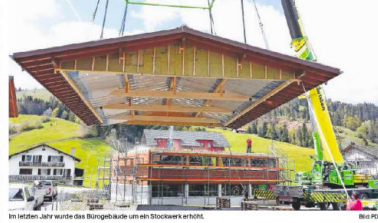
Im letzten Jahr wurde das Biologiehaus um ein Stockwerk erhöht.

Lebhafter Handel auch beim Zucht- und Metzvieh. Wenig Preise bestanden jedoch der Käsemarkt. «Trotz Einfrieren von 6000 Tonnen Käsefleisch zur Medikamentierung mussten die Produzenten von Mai bis Juli Tiefenpreise akzeptieren», heißt es weiter. Anschließend stiegen die