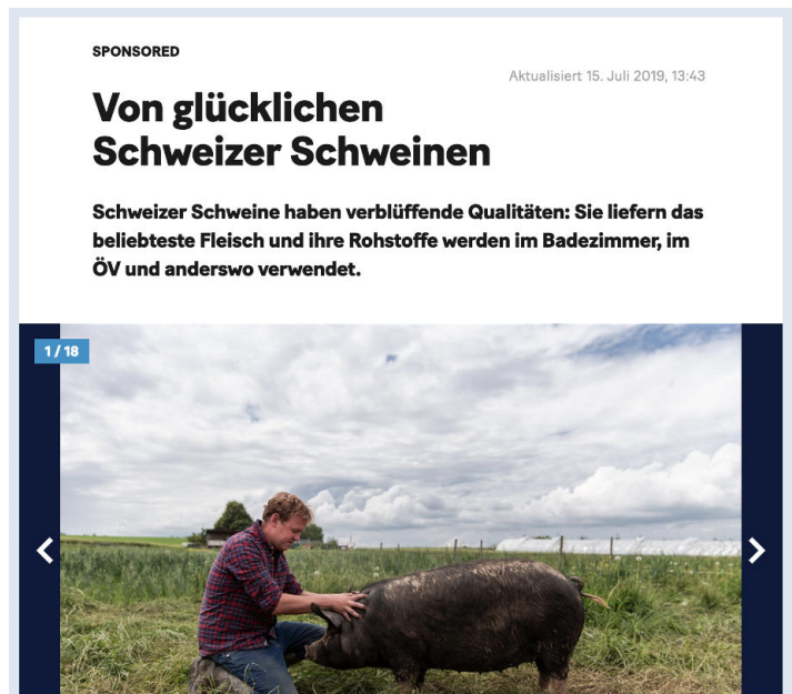
Zu sehen: Sponsored Content der Fleischindustrie.